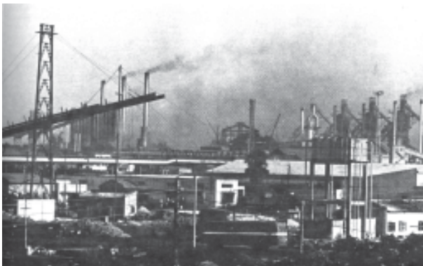
चित्र 9.2 दामोदर घाटी भारत के सर्वाधिक औद्योगिक क्षेत्रों में एक है। भारी उद्योगों से प्रदूषणकारी तत्व दामोदर नदी के किनारे जमा होकर पर्यावरण-संकट उत्पन्न कर रहे हैं

की दर से कम थी। इसलिए, पर्यावरण समस्याएँ उत्पन्न नहीं हुई थी। लेकिन, जनसंख्या विस्फोट और जनसंख्या की बढ़ती हुई आवश्यकताओं की पूर्ति के लिए औद्योगिक क्रांति के आगमन से स्थिति बदल गई। परिणामस्वरूप उत्पादन और उपभोग के लिए संसाधनों की माँग संसाधनों की पुनः सर्जन की दर से बहुत अधिक हो गई; पर्यावरण की अवशोषी क्षमता पर दबाव बुरी तरह से बढ़ गया। यह प्रवृत्ति आज भी जारी है। इस तरह से, पर्यावरण की गुणवत्ता के मामले में