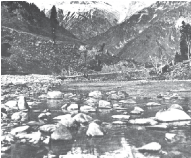
चित्र 9.1 ताजा पानी के कुछ स्रोत जो प्रदूषण रहित हैं

ऐसा नहीं होता, तो पर्यावरण जीवन पोषण का अपना तीसरा और महत्वपूर्ण कार्य करने में असफल हो जाता है और इससे पर्यावरण संकट पैदा होता है। पूरे विश्व में आज यही स्थिति है। विकासशील देशों की तेजी से बढ़ती जनसंख्या और विकसित देशों के समृद्ध उपभोग तथा उत्पादन मानकों ने पर्यावरण के पहले दो कार्यों पर भारी दबाव डाल डाला है। अनेक संसाधन विलुप्त हो गये हैं और सृजित अवशेष पर्यावरण के अवशोषी क्षमता के बाहर हैं।