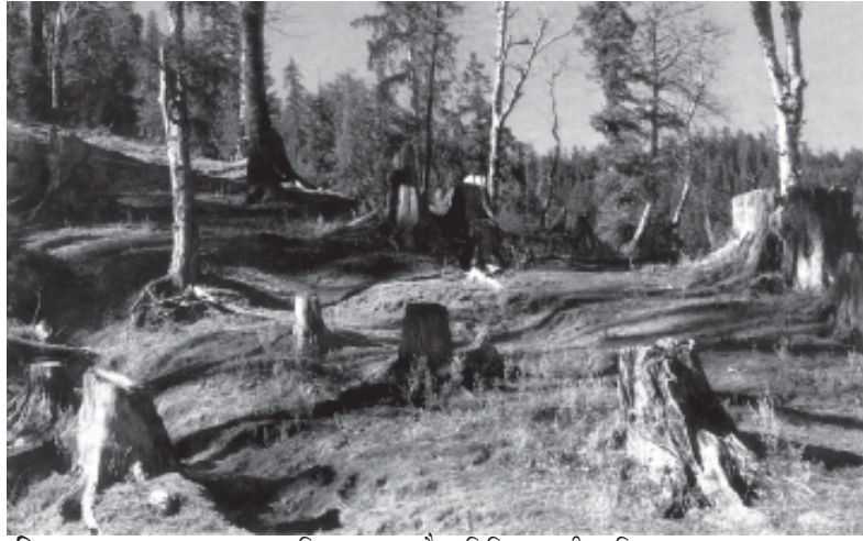
चित्र 9.3 वन-कटाव द्वारा भूमि अपक्षय, जैव विविधता की क्षति तथा वायु प्रदूषण

माँग-पूर्ति संबंध पूरी तरह से उलट गये हैं-अब हमारे सामने पर्यावरण संसाधनों और सेवाओं की माँग अधिक है, लेकिन उनकी पूर्ति सीमित है। जिसके कारण अधिक उपयोग और दुरुपयोग हैं। इसीलिए, अवशिष्ट सृजन और प्रदूषण के पर्यावरण मुद्दे आजकल बहुत गंभीर हो गये हैं।