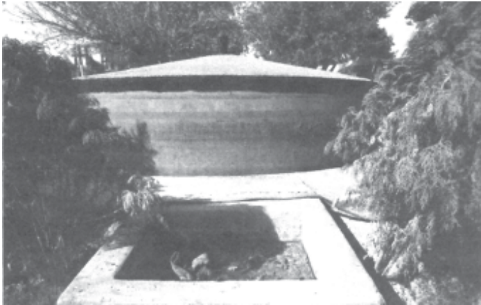
चित्र 9.4 गोबर गैस संयंत्र में ईंधन उत्पादन के लिए गोबर का प्रयोग

ऊर्जा के गैर पारंपरिक स्रोतों का उपयोग : जैसा कि आप जानते हैं कि भारत अपनी विद्युत आवश्यकताओं के लिए थर्मल और हाइड्रो पॉवर संयंत्रों पर बहुत अधिक निर्भर है। इन दोनों का पर्यावरण पर प्रतिकूल प्रभाव पड़ता है। थर्मल पॉवर संयंत्र बड़ी मात्रा में कार्बन-डाइऑक्साइड का उत्सर्जन करते हैं, जो एक ग्रीन हाउस गैस है। थर्मल पॉवर प्लांटों से बड़ी मात्रा में धुएँ के रूप में राख भी निकलती है, जिसका उचित उपयोग न हो तो जल, भूमि और पर्यावरण के अन्य संघटकों के प्रदूषण का कारण हो सकता है। जल-विद्युत परियोजनाओं से वन जलमग्न हो जाते हैं और नदी प्रवाह क्षेत्रों तथा नदी की घाटियों के प्राकृतिक प्रवाह में हस्तक्षेप करते हैं। वायु शक्ति और सौर किरणें पारंपरिक ऊर्जा के अच्छे उदाहरण हैं, लेकिन स्वच्छ और हरित प्रौद्योगिकी का प्रयोग प्रभावशाली रूप से थर्मल और हाइड्रो शक्ति के स्थान पर हो सकता है।